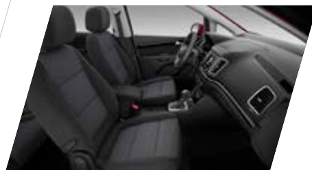
● Intérieur Tissu Noir - [DM]