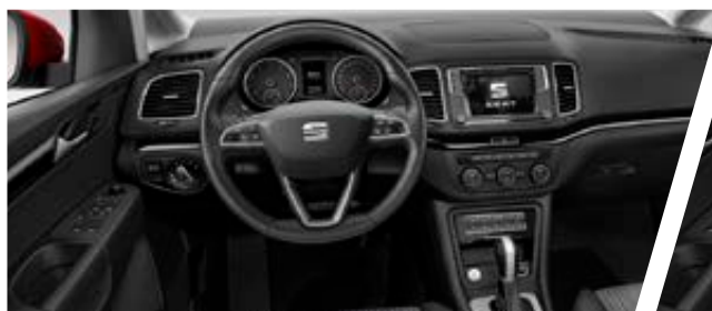
Intérieur STYLE avec sellerie tissu noir