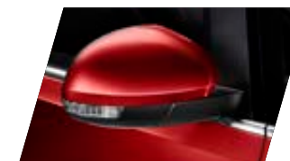
○ Rouge Romance - [W0W0] Métallisée Prix client 765 €