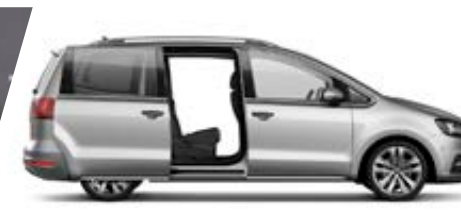
Portes Latérales Électriques