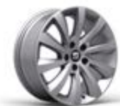
○ Jantes alliage 17" « DYNAMIC » pneumatiques 225/50 R17 [PUB] 480 €