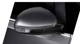
○ Gris Indium - [X3X3] Métallisée Prix client 765 €