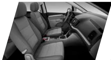
● Intérieur Tissu Gris - [XC]