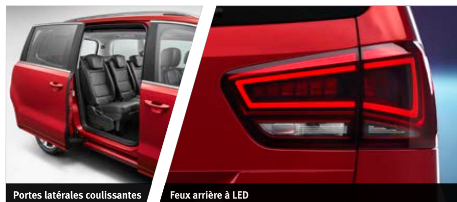
Portes latérales coulissantes