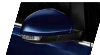
○ Bleu Atlantique - [H7H7] Métallisée Prix client 765 €