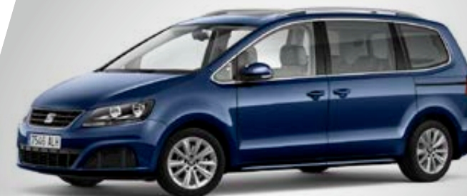
Finition REFERENCE (visuel présenté avec options)