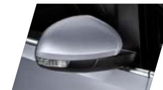
○ Gris Lune - [9019] Métallisée Prix client 765 €