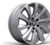
● Jantes alliage 17" « DYNAMIC » pneumatiques 225/50 R17 [PUB]