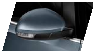
● Gris Urano - [5K5K] Vernie