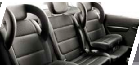
2 sièges enfant intégrés