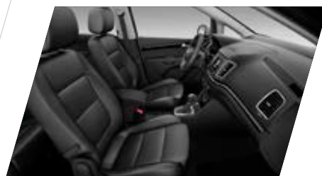
○ Cuir Noir et autres matériaux (2) - [JJ+WL1] Prix client 2 270 €