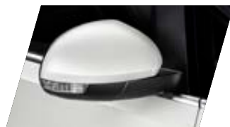
○ Blanc - [0Q0Q] Vernie Prix client 250 €