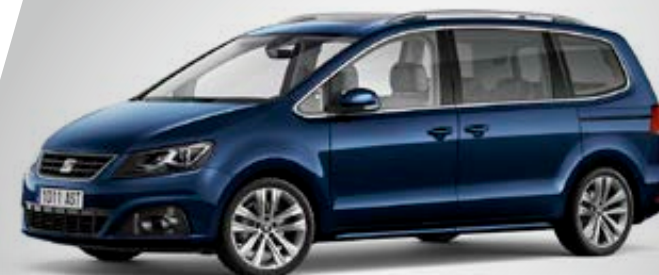
Finition STYLE (visuel présenté avec options)