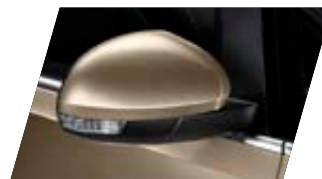
○ Pyramide or - [I2I2] Métallisée Prix client 765 €