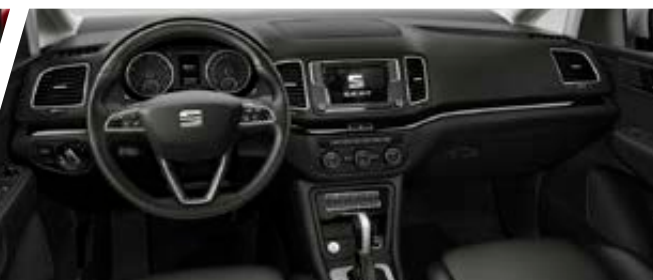
Intérieur PREMIUM 7 avec cuir noir