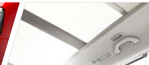
Toit ouvrant panoramique