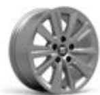
● Jantes alliage léger 16" « DESIGN » pneumatiques 215/60 R16