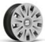
● Enjoliveur 16" « URBAN » pneumatiques 205/60 R16 96H