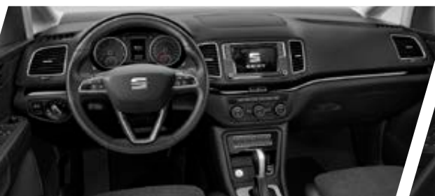
Intérieur PREMIUM 7 avec Alcantara noir