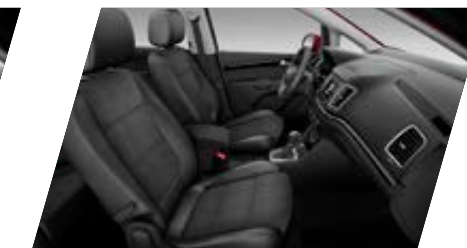
○ Alcantara et similicuir (1) - [JJ + PLT] Prix client 610 €