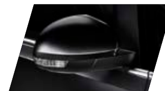
○ Noir Intense - [2T2T] Métallisée Prix client 765 €