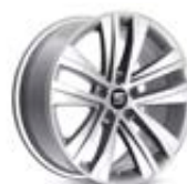
○ Jantes alliage 18" « AKIRA » pneumatiques 225/45 R18 avec suspensions sport [PUK] 960 €