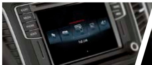
Système de navigation tactile 6,5" avec Full Link

● : de série ○ : en option - : non disponible