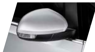
○ Gris Argent - [K8K8] Métallisée Prix client 765 €