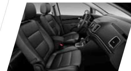
○ Cuir Noir et autres matériaux (2) - [JJ+WL1] Prix client 1 660 €