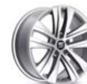
○ Jantes alliage 18" « AKIRA » pneumatiques 225/45 R18 avec suspensions sport [PUK] 480 €