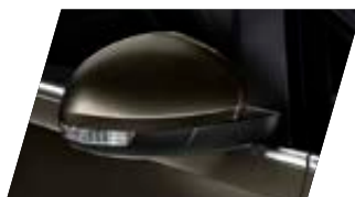
○ Brun Chene - [P0P0] Métallisée Prix client 765 €