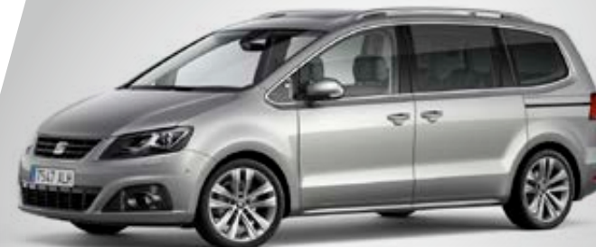
Finition PREMIUM 7 (visuel présenté avec options)